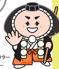
小松市イメージキャラクター カブッキー

小松市へのお越しをお待ちしています! 各種会議や合宿、スポーツ大会に便利なコンベンション施設が充実の小松市。 コンベンションを開催する費用の一部を応援する制度に加えて、うれしい特典もあります。 團十郎芸術劇場うららや市民センター、こまつドーム、小松運動公園など、